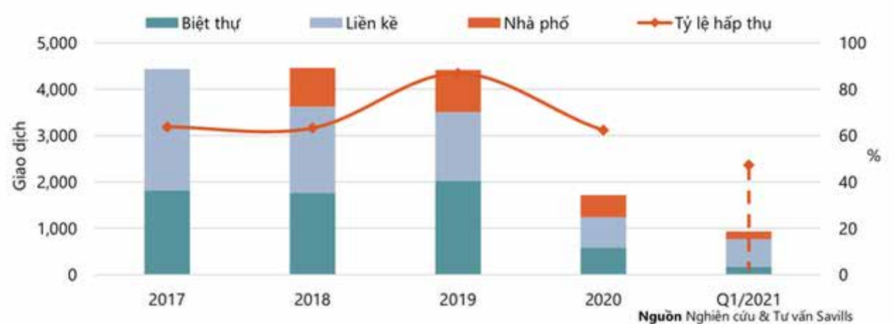
Tình hình giao dịch biệt thự, liền kề, nhà phố