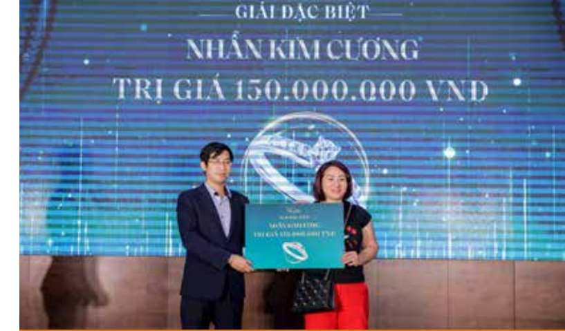
Khách hàng may mắn trúng giải đặc biệt là nhẫn kim cương trị giá 150.000.000 VNĐ

Bên cạnh những ưu thế vượt trội về vị trí, thiết kế,... một trong những yếu tố cốt lõi tạo nên sức hút đặc biệt của Him Lam Vạn Phúc đó là pháp lý hoàn chỉnh, sổ đỏ lâu dài và sẽ được bàn giao đúng cam kết. Không chỉ là chốn an cư, Him Lam Vạn Phúc còn là thiên đường trải nghiệm đẳng cấp, tiện nghi dành cho gia chủ.