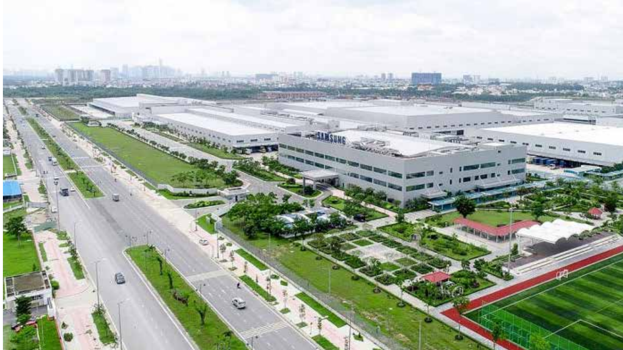
Phân khúc bất động sản công nghiệp thu hút dòng vốn đầu tư nước ngoài nhiều nhất.