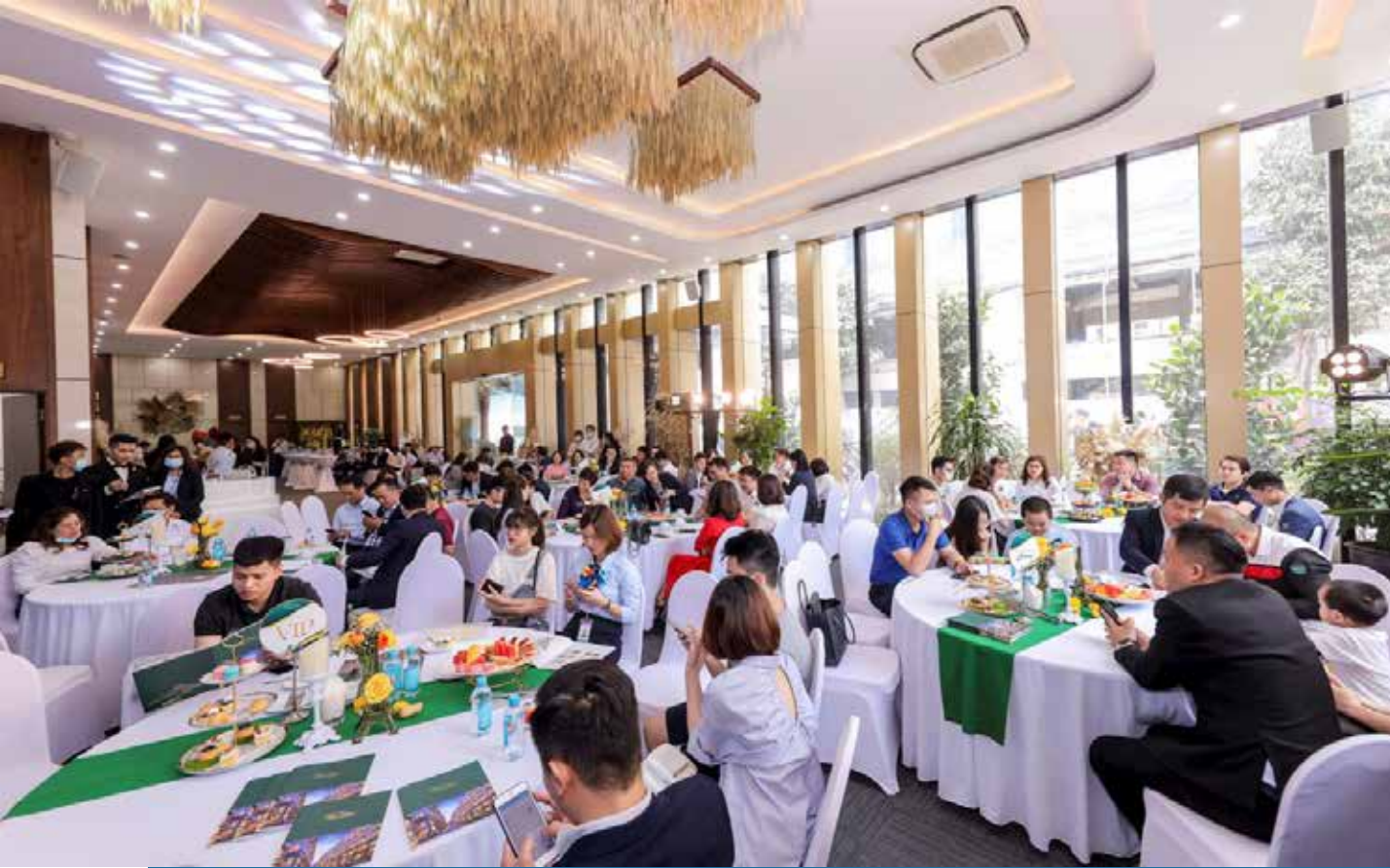
Sự kiện bán hàng tháng 4 thu hút đông đảo khách hàng tham dự.

VOVLIVE - Sáng ngày 4/4/2021, sự kiện bán hàng tháng 4 với chủ đề "Siêu phẩm shophouse đẳng cấp bậc nhất Hà Nội - Him Lam Vạn Phúc" đã thu hút đông đảo khách hàng tham dự và nhiều giao dịch thành công.