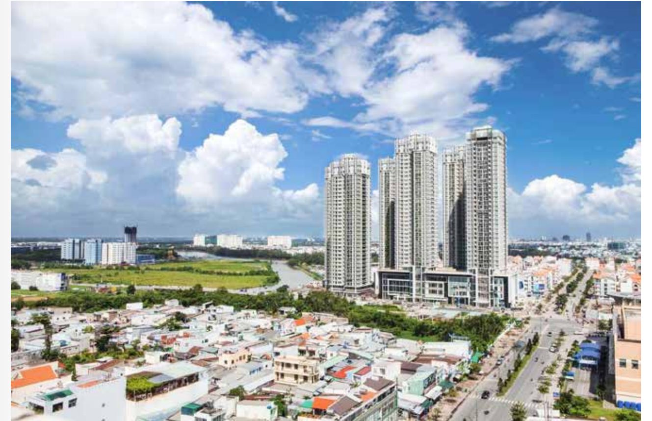
Bất động sản Việt Nam đang ngày càng hấp dẫn nhà đầu tư nước ngoài.

Sự tăng trưởng kinh tế sẽ kéo theo nhu cầu về các loại hình bất động sản gia tăng, điều này cho thấy Việt Nam sẽ tiếp tục là điểm đến thuận lợi của dòng vốn trong tương lai.