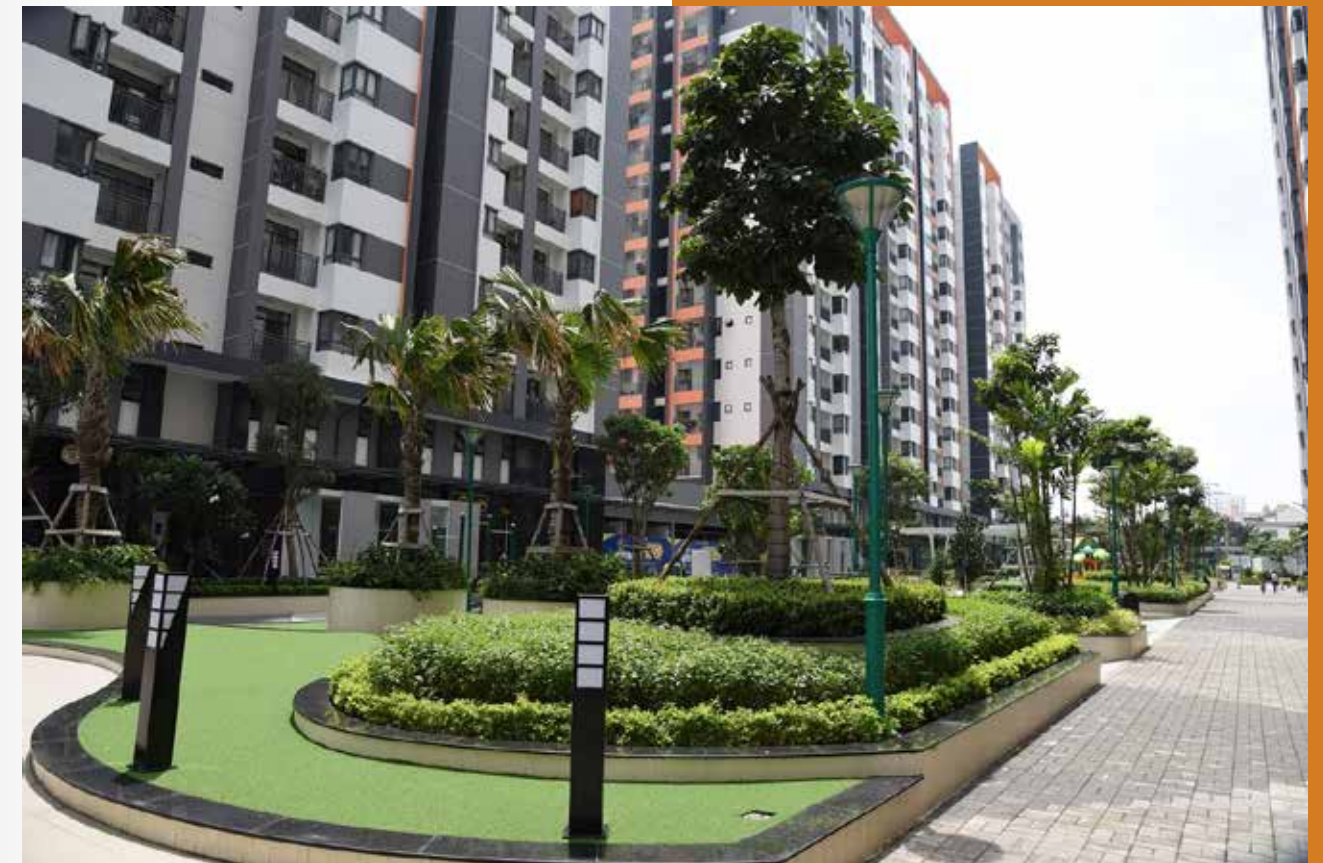
Chung cư Him Lam Phú An, quận 9, TP.Thủ Đức

Theo công văn số 4509/UBND-ĐT ngày 08/10/2018 của Ủy ban nhân dân thành phố Hồ Chí Minh về quy hoạch mạng lưới trạm trung chuyển rác trên địa bàn thành phố thì định hướng giai đoạn đến năm 2025 sẽ dừng hoạt động Trạm trung chuyển rác Phước Long A. Tuy nhiên với thực trạng của Trạm trung chuyển rác