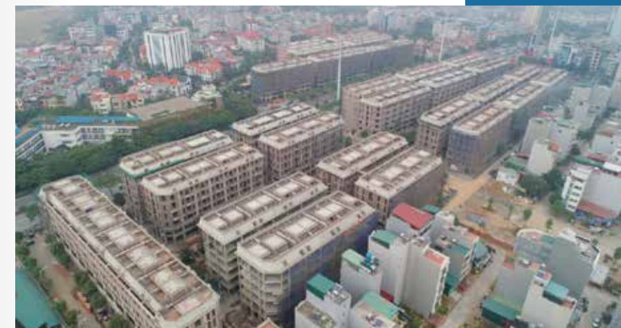
Him Lam Vạn Phúc sở hữu nhiều ưu thế vượt trội.

Tầng 3, 4, 5, 6 là không gian được bố trí riêng tư, ấm cúng dành cho gia đình.